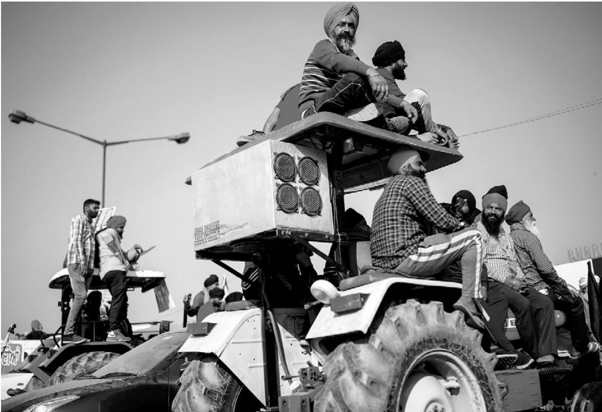
Farmers sit on a tractor as they listen to a speaker during a protest against the newly passed farm Acts, at Singhu border near New Delhi, on Wednesday