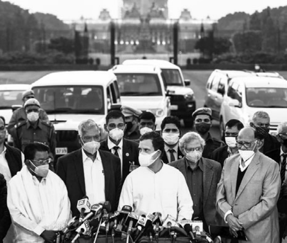
Congress leader Rahul Gandhi, Left-wing party leaders D Raja and Sitaram Yechury, NCP chief Sharad Pawar and others address media after a delegation of Opposition leaders met President Ram Nath Kovind at Rashtrapati Bhavan and presented a memorandum regarding farmers issue

The government will have to carry out an intricate and adroit balancing exercise. Politics will force it to be restrained in dealing with the farmers, leaving it hamstrung in resorting to traditional coercive measures like using teargas and firing to dislodge the agitating farmers who